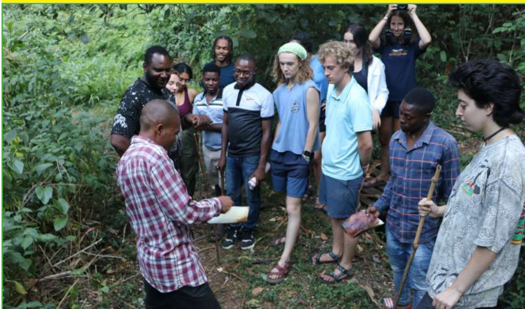
Mhifadhi wa Msitu wa Mazumbai, Tanga akitoa maelezo kwa watalii na watafiti wakiwa kwenye msitu huo.

Chuo Kikuu cha Sokoine cha Kilimo (SUA) kimeendelea kupokea Watafiti, Wanasayansi na Watalii kutoka nchi mbalimbali duniani wanaokwenda kujifunza, kufanya tafiti na utalii juu ya masuala mbalimbali ya Misitu na Viumbe wengine wengi kwenye Msitu wa Hifadhi Mazumbai unapatikana Jimbo la Bumbuli Mkoani Tanga. Msitu huo haujawahi kuguswa toka miaka ya 1800 enzi za ukoloni wa Mjerumani.