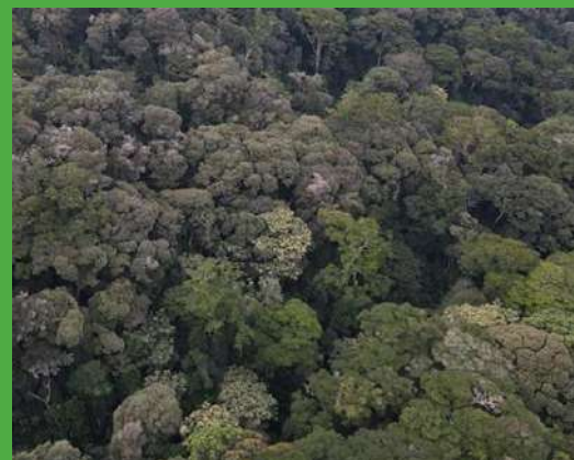
Msitu wa Hifadhi wa Mazumbai, Tanga.