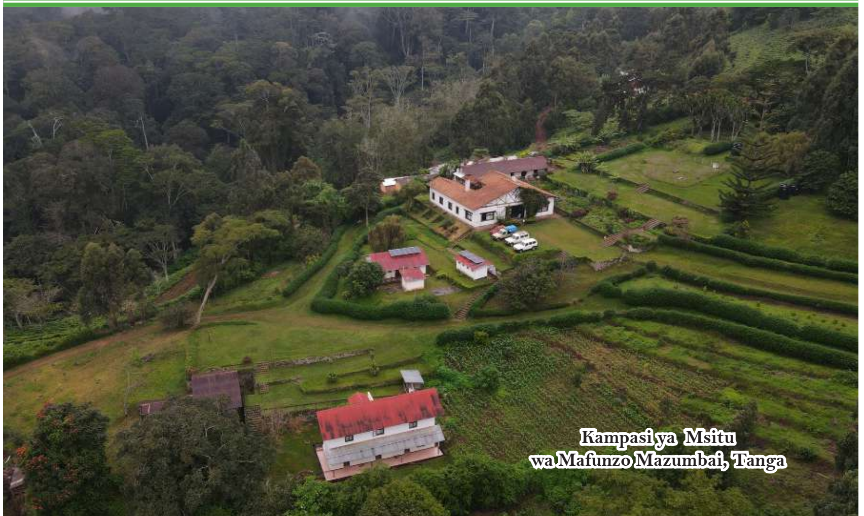
Kampasiya Msitu wa Mafunzo Mazumbai, Tanga