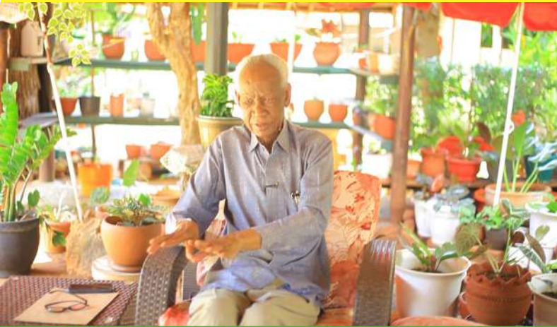
Mkuu wa Chuo Kikuu cha Sokoine cha Kilimo (SUA) Mhe. Jaji Mstaafu Joseph Sinde Warioba akiongea na Waandishi wa Habari, (hawapo pichani).

Mkuu wa Chuo Kikuu cha Sokoine cha Kilimo (SUA) Mhe. Jaji Mstaafu Joseph Sinde Warioba amesifu kazi nzuri inayofanywa na SUA katika kutoa elimu kwa wataalam mbalimbali wa kilimo ambao wamekuwa kichocheo katika kuinua Sekta ya kilimo nchini.