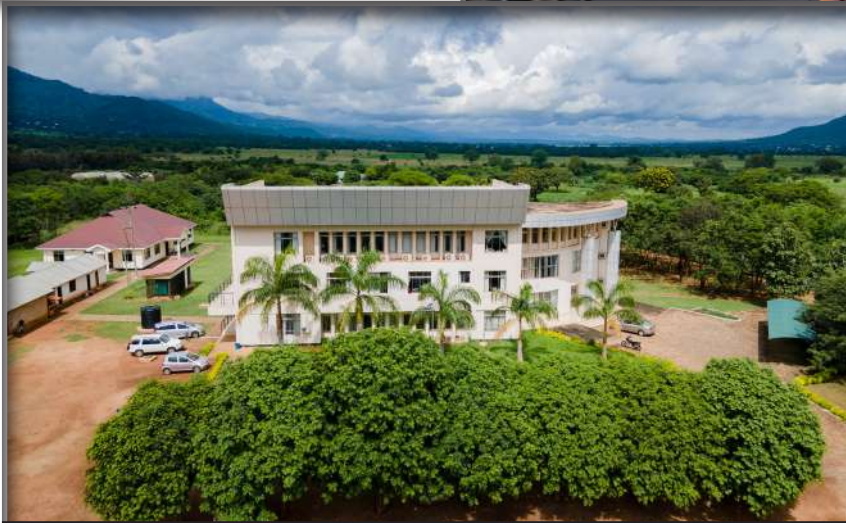
Ndaki ya Uchumi na Stadi za Biashara