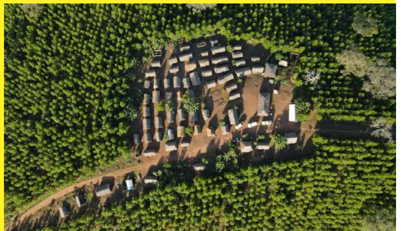
Msitu wa Mafunzo wa Ifinga uliopo Madaba mkoani Ruvuma