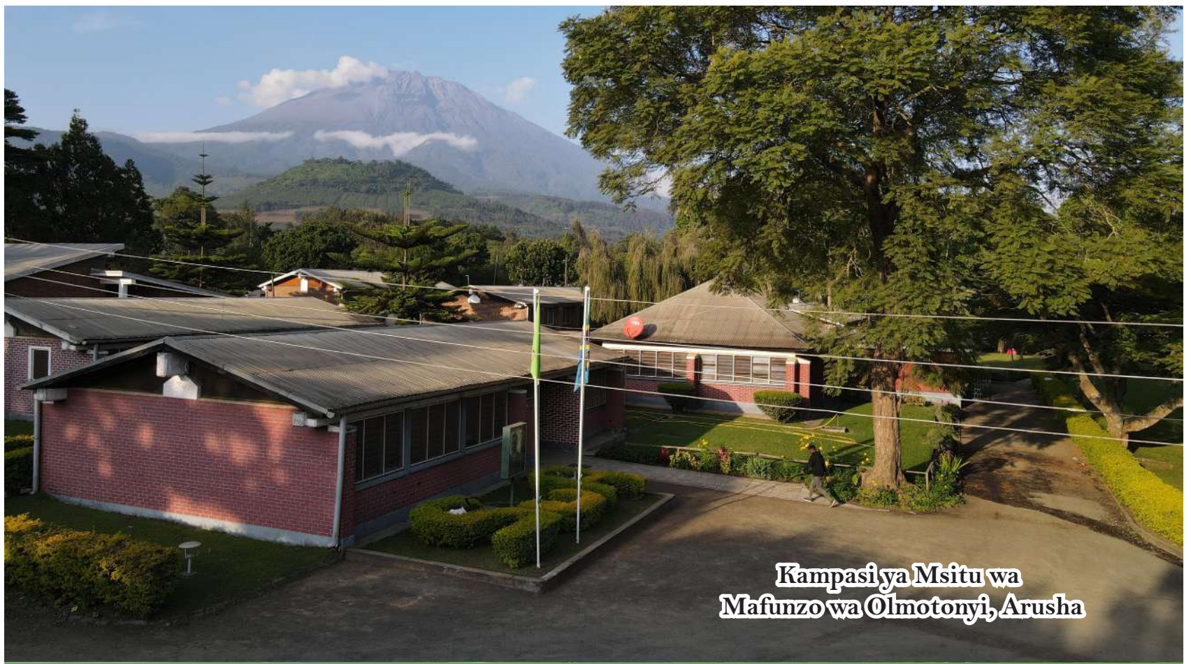
Kampasiya Msitu wa Mafunzo wa Olmotonyi, Arusha